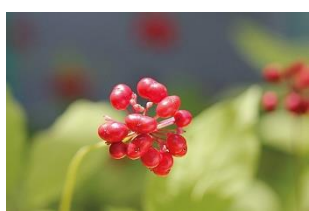
オタネニンジン根エキス