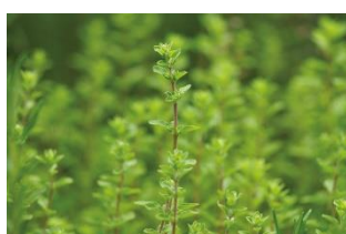
マジョラムエキス