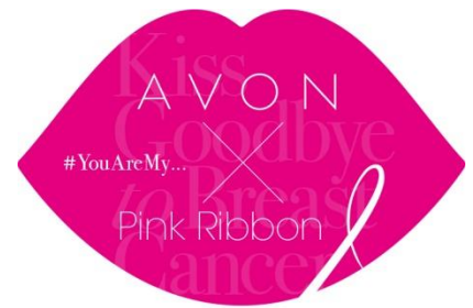
(左)“Kiss Photo Space”イメージ(右)Kiss Goodbye to Breast Cancerステッカー